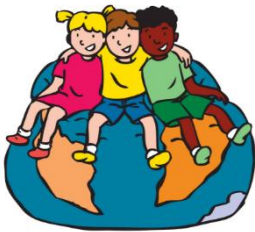
We horen bij elkaar

De eerste twee weken van het schooljaar noemen scholen vaak 'Gouden Weken'. In deze weken wordt veel gedaan om een positief klassenklimaat te bevorderen. Het eerste thema van onze methode 'Vreedzame school' wordt helemaal behandeld. Het thema heet 'We horen bij elkaar'. In deze lessen worden kennismakingsoefeningen gedaan, zoals 'zoek iemand die'. Er worden wat extra energizers gedaan, zoals zonder praten op alfabetische volgorde gaan staan in de klas. Ook wordt er extra gelet op de schoolregels en groepsregels en maken de groepen afspraken met elkaar. Tijdens de startgesprekken liggen deze afspraken in de groep en vragen we u als ouder om deze ook te tekenen. Zo weet uw kind dat u deze afspraken ook